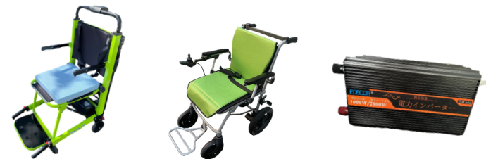
階段用車椅子 (らく段)