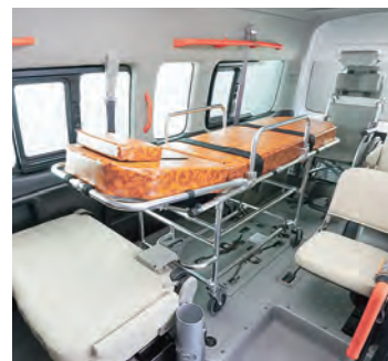
車いす1名とストレッチャーの乗車も可能