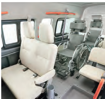
車いす2名と8名でゆったりと乗車