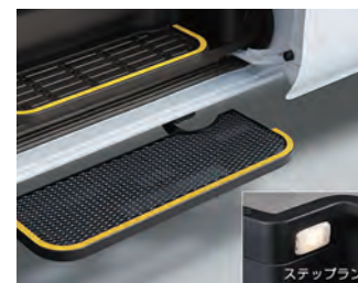
乗り降りしやすいオートステップ

電動リフト付き車両で車いす、ストレッチャーを利用したままで車両に乗降することができます。もちろん付き添いの方も同乗いただけます。