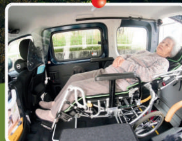
背もたれを倒したままご乗車いただけます