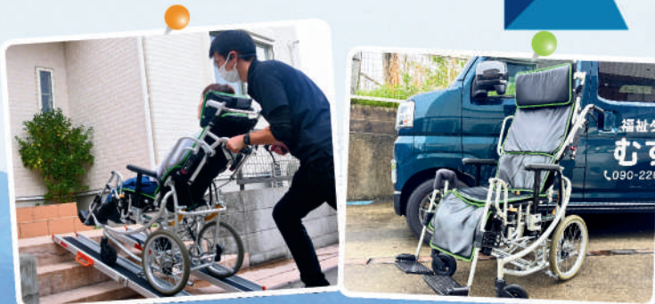
スロープや車椅子をご用意しています