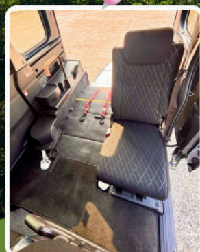
お連れ様も、お隣にご乗車いただけます